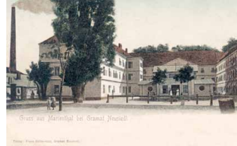
Im Hintergrund das sogenannte Altgebäude, welches 1833 als zweite Textilfabrik Marienthal anstelle der ersten errichtet und welches 1845 zu einem Arbeiterwohnhaus umgestaltet und 2008 abgerissen wurde. Im Hof dieses Gebäudekomplexes steht der Consum, gleichsam im geografischen Mittelpunkt Marienthals. Der Platz vor dem Consum, wo heute das Museum Marienthal steht, war der wichtigste Kommunikationsort der Marienthaler Bevölkerung im öffentlichen Raum. Postkarte Gramat Neusiedl (um 1898). © Reinhard Müller, AGSÖ (Graz)

Forum Museum. NÖ Museumsjournal (Atzenbrugg), 2/2011-1/2012. © Volkskultur Niederösterreich GmbH